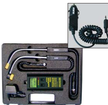
Nr. 28 700 + 28 692