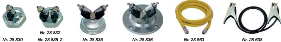
Zur Überprüfung des Gasdruckes