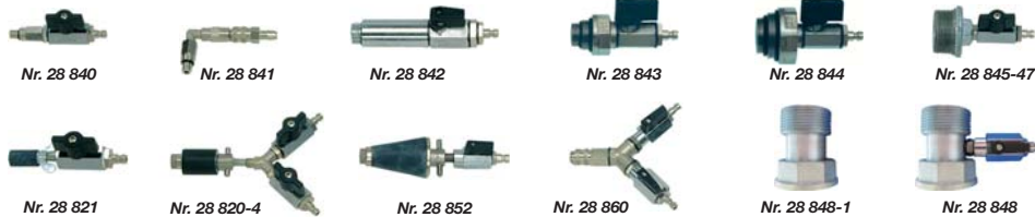
Doppel-Kugelhahn zum gleichzeitigen Anschluß von Luftpumpe u. Dichtprüfergerät

Prüfanschlüsse DBGM aus VA mit O-Ring-Abdichtung für Gewinde-Fittings R 1 / 2 u. 3 / 4 '' bzw. 1 u. 1 1 / 4 ''