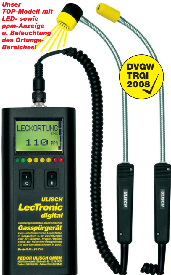
Nr. 28 700 Nr. 28 692

Unser TOP-Modell mit LED- sowie ppm-Anzeige u. Beleuchtung des Ortungs-Bereiches!