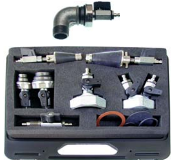
Sort. Gas-Prüfanschl. Nr. 28 856